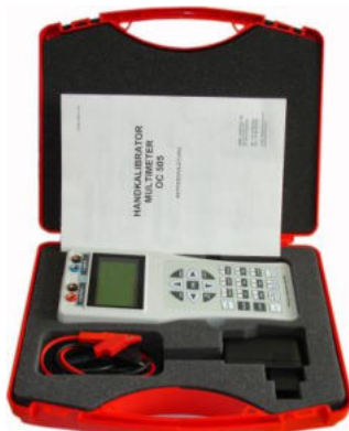
IOC505 im Koffer mit Zubehör